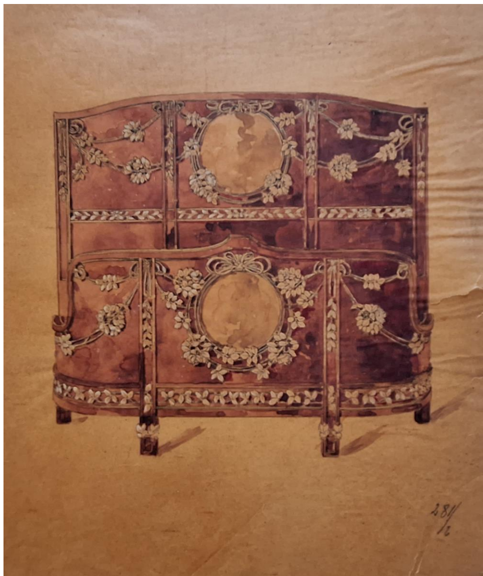
Ufficio Tecnico Ducrot, lettone della stanza da letto presentata all'Esposizione Internazionale del Sempione di Milano del 1906 ; ridisegno da fotografia del mobile realizzato dagli «Stabilimenti Ducrot - Palermo» su disegni di Ernesto Basile, con la collaborazione di Giuseppe Enea per le pitture Vernis Martin. Matita e inchiostro di china acquarellato su carta da lucido; Archivio Ducrot, Collezioni Scientifiche del Dipartimento di Architettura, Università degli Studi di Palermo.