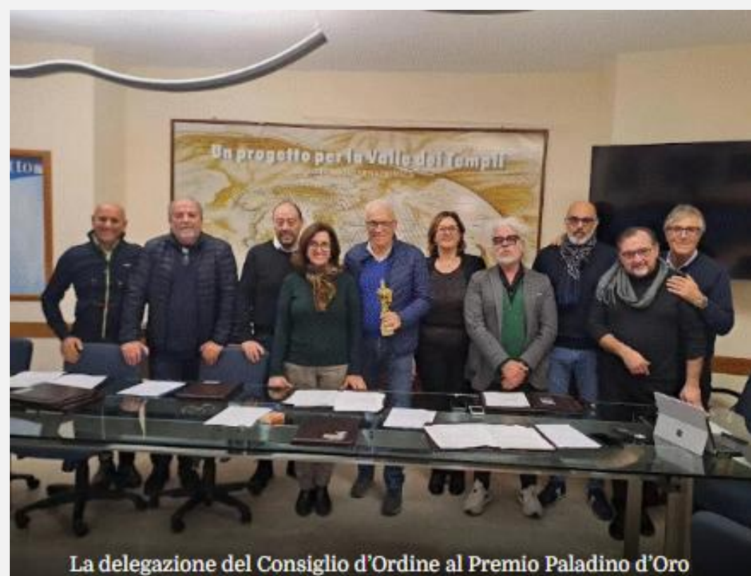
La delegazione del Consiglio d'Ordine al Premio Paladino d'Oro