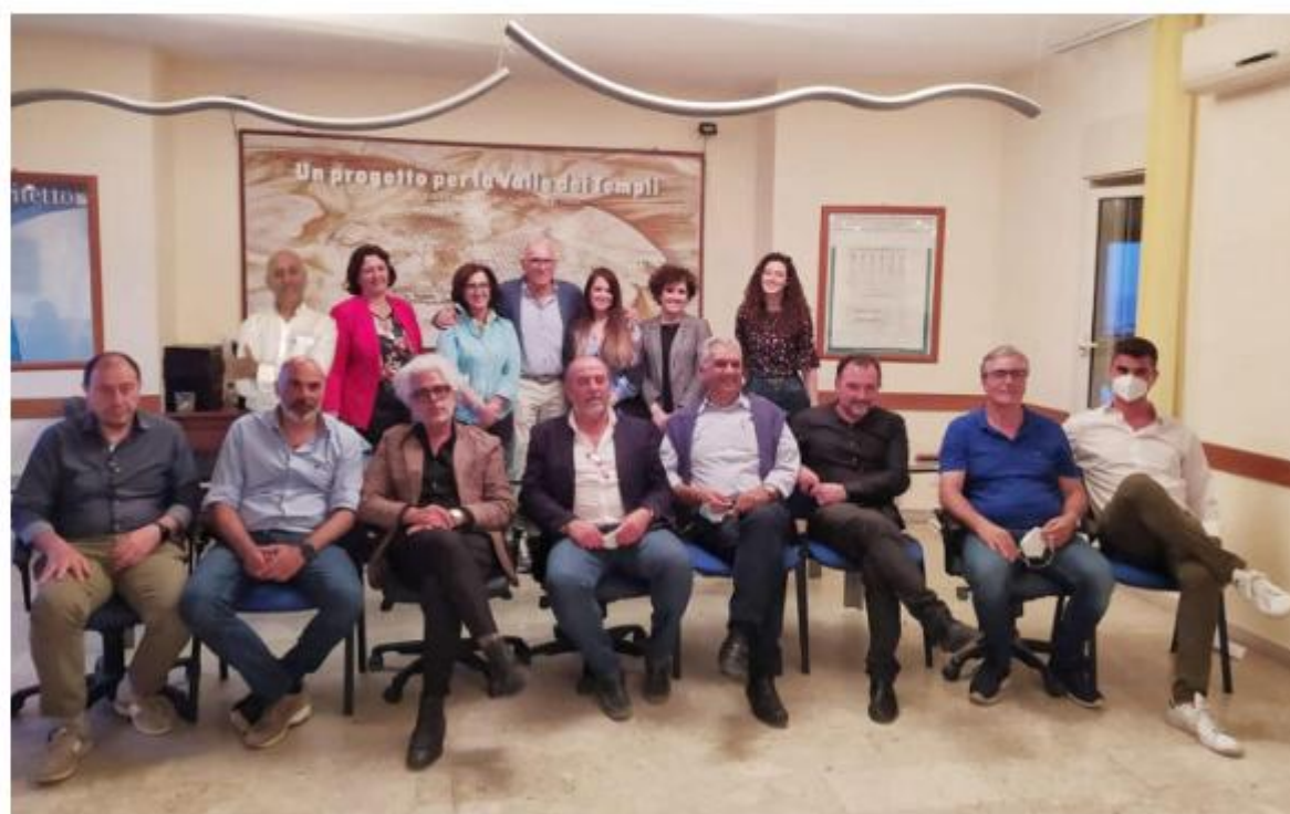
Il Consiglio dell'Ordine degli architetti

Tra le iniziative culturali, si inserisce il Simposio dello scorso 29 gennaio sul tema “Musealizzazione dei siti archeologici”, nell'ambito del gemellaggio Sicilia-Corea del Sud, celebrato in occasione del 140° anno delle “Relazioni diplomatiche tra Corea del Sud e Italia”; la presentazione, al MAXXI di Roma, degli esiti agrigentini della quinta edizione del progetto Abitare il Paese che anche nel 2024 ha reso gli studenti di tre scuole gli istituti comprensivi Agrigento Centro di Agrigento e Rapisardi di Canicattì e il liceo scientifico Leonardo di Agrigento) protagonisti della progettualità e della valorizzazione del territorio in cui vivono. E ancora, l'edizione 2024 di Open Studi Aperti, con una mostra di progetti di architetti agrigentini nell'atrio superiore del Palazzo Comunale di Sciacca, arricchita da interessanti momenti artistici e musicali, che ha pienamente coinvolto, non solo gli addetti ai lavori, ma anche e soprattutto il grande pubblico, trasformando Sciacca, per due giorni, in una vetrina nazionale sull'architettura prodotta in provincia di Agrigento.