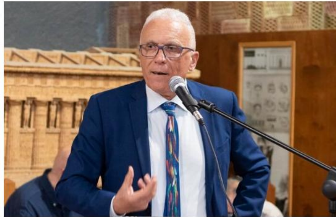
Rino La Mendola

Con queste parole il Presidente dell’Ordine degli architetti, Rino La Mendola, lancia l’ennesimo appello alle istituzioni competenti e ai rappresentanti nazionali della politica agrigentina per sollecitare quel “via libera” dell’ENAC che aprirebbe le porte all’inserimento dello scalo agrigentino nella programmazione nazionale degli aeroporti avviando, dunque, un percorso concreto per la realizzazione di un’infrastruttura fondamentale per il rilancio socio-economico della città e della provincia di Agrigento.